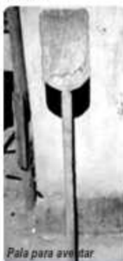
Pala para aventar