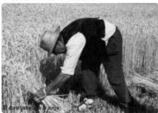
El duro trabajo que es la siega

¿Existe hoy motivación por el campo?. No voy a definirme ni a expresar mi pensamiento. Sí, los tiempos han evolucionado con sus