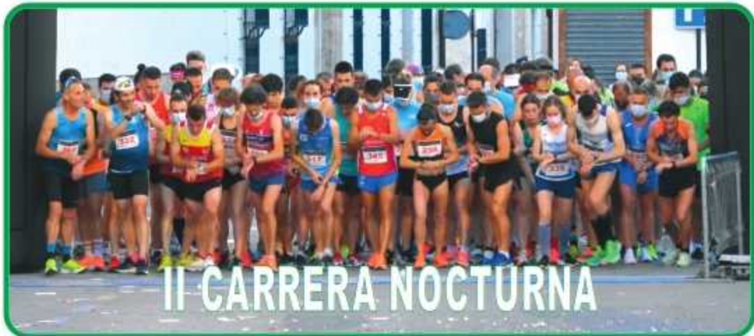
II CARRERA NOCTURNA