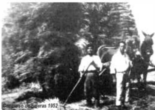
Concurso de galeras 1952