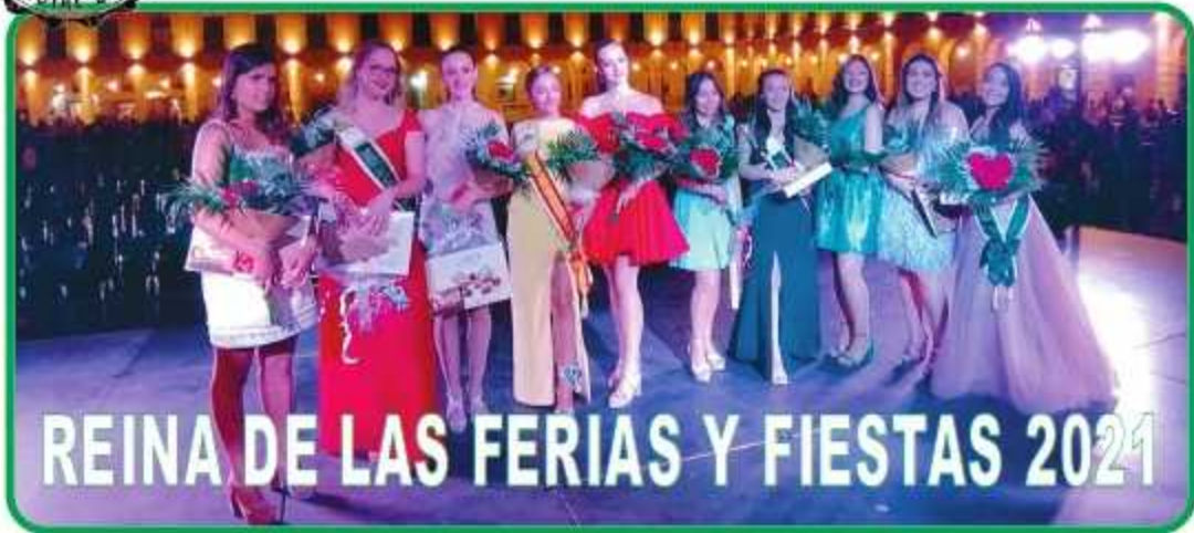
REINA DE LAS FERIAS Y FIESTAS 2021

INDEPENDIENTE DE INFORMACIÓN LOCAL Y GENERAL - AÑO XVII - Nº 199/200 - JULIO/AGOSTO 2021