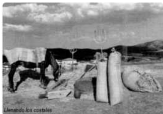
Llenando los costales

tecnologías, grandes cosechadoras, tractores cada vez más potentes, y un largo etc. pero en otros tiempos, a pesar de ser muy duros, había un apego y un amor desmesurado por lo suyo y quizás se viviera más pensando en el mañana y no en el hoy como creo está ocurriendo.