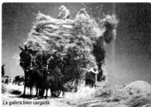
La galera bien cargada