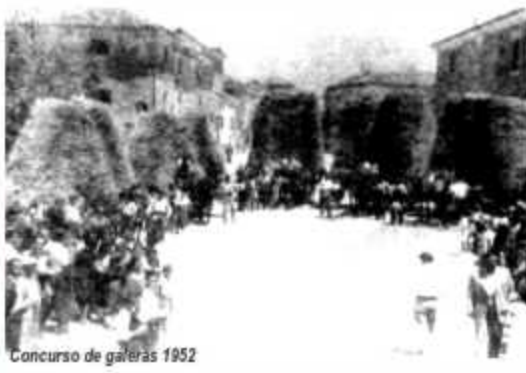
Concurso de galeras 1952