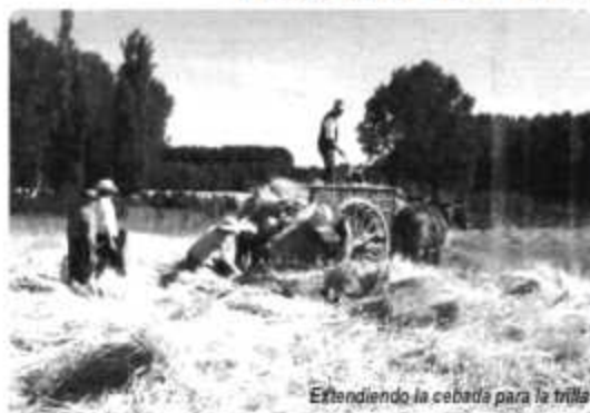
Extendiendo la cebada para la trilla